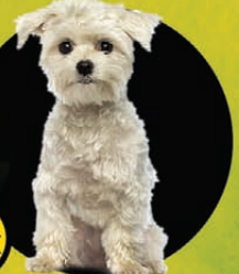
sbnsV de cadells