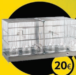
Gàbia cria 60cm